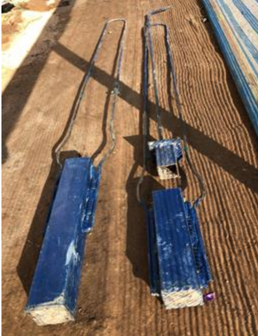
Fotos 1 e 2. Vista dos coletores executados na obra.