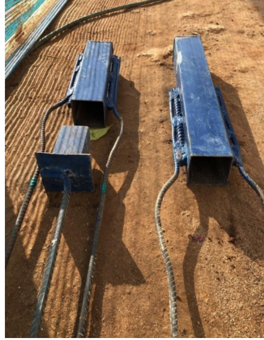
Fotos 3 e 4. Vista do coletor em uso e preenchido com concreto.