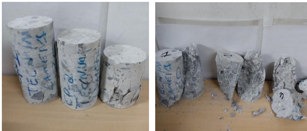
Fotos 5 e 6 – Vista dos corpos de prova extraídos antes e após o ensaio de ruptura